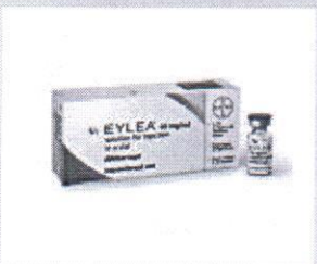
Айлия флакон 40мг/мл 0.278мл №1 15110.00 грн.