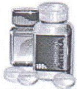
Шободованый врэменты офтальмологичекий