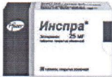
Инспра таб 25мг №30 1663.00 грн.