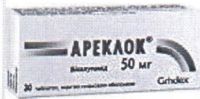
Ареклок таб 50мг №30 1960.00 грн.