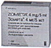
Зомета флакон 4мг №1 2184.21 грн.