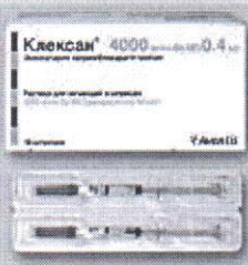
Клексан шпр 40мг 0.4мл 1228.60 грн.