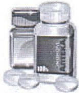
зображення временно відсутнє