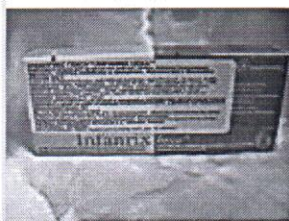
Инфанрикс Гекса фл 1доз №1 562.99 грн.