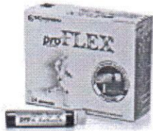
ПроФлекс р-р флакон 25мл №14 569.83 грн.