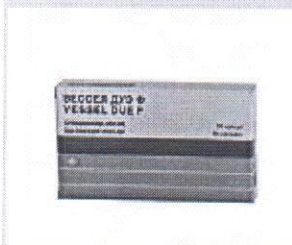
Вессел Дуэ Ф капс 250ЛЕ №50 1079.92 грн.