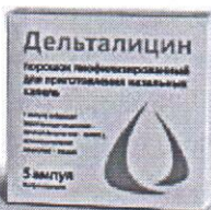
Дельталицин пор.д/приг наз. кап ампула 0.003г №5 1250.00 грн.