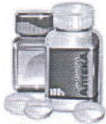
зображення временно відсутнє