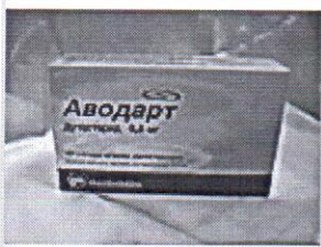
Аводарт капс 0.5мг №30 404.76 грн.