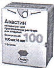
Авастин флакон 100мг 4мл №1 9360.00 грн.